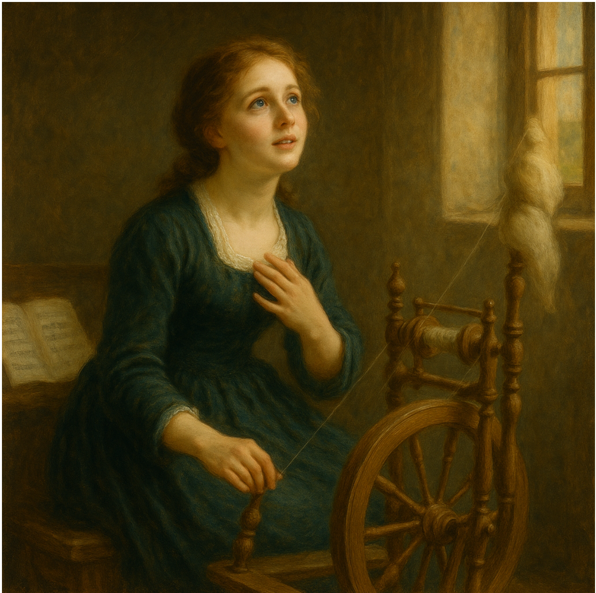
Gretchen am Spinnrade